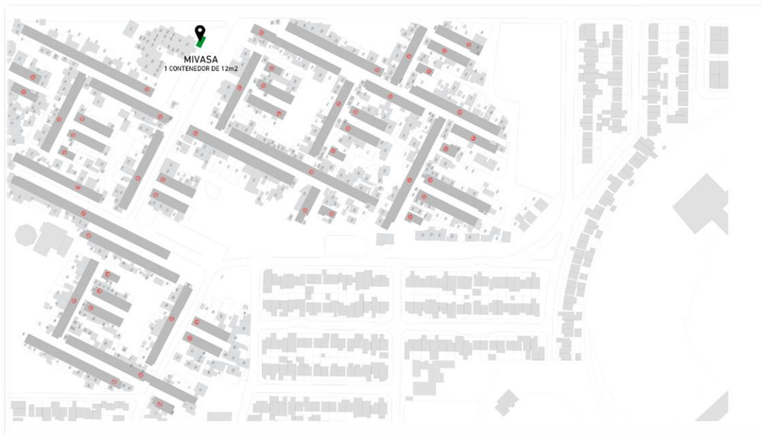
Imagen 1. Ubicación del obrador.

El obrador estará ubicado en un predio acordado con el Municipio de Morón, y en forma previa al inicio de obra, realizando el acondicionamiento del terreno en un área mínima compatible con los requerimientos constructivos. El obrador constará de un contenedor de chapa recubierto de placas aislantes, cuya dimensión se estima en 12 metros cuadrados, y estará ubicado en la calle Andrés Ferreyra 4122 esquina Villegas del barrio de referencia. Ver Imagen 1.